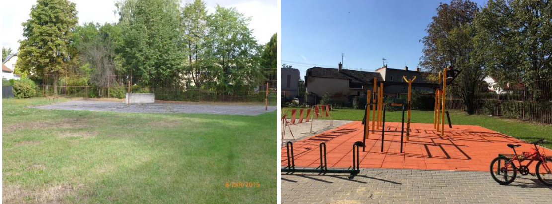
Obrázek 3: Původní plocha dětského hřiště a nové workout hřiště – 17. listopadu