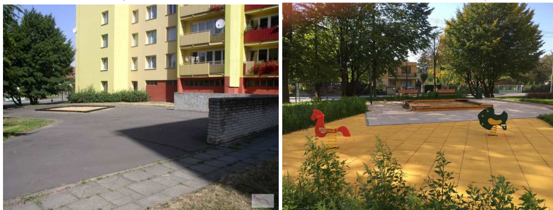
Obrázek 1 Původní plocha dětského hřiště a nové dětské hřiště – sídliště 17. listopadu